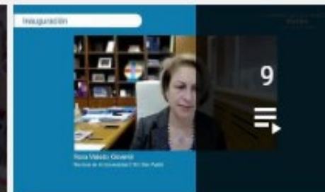
CONGRESO DE BIOÉTICA CEU 2021