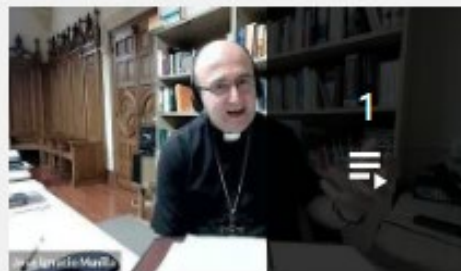
DOCTRINA SOCIAL DE LA IGLESIA