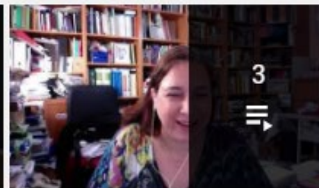
MEDICINA NARRATIVA: IX Simposio de Humanidades...