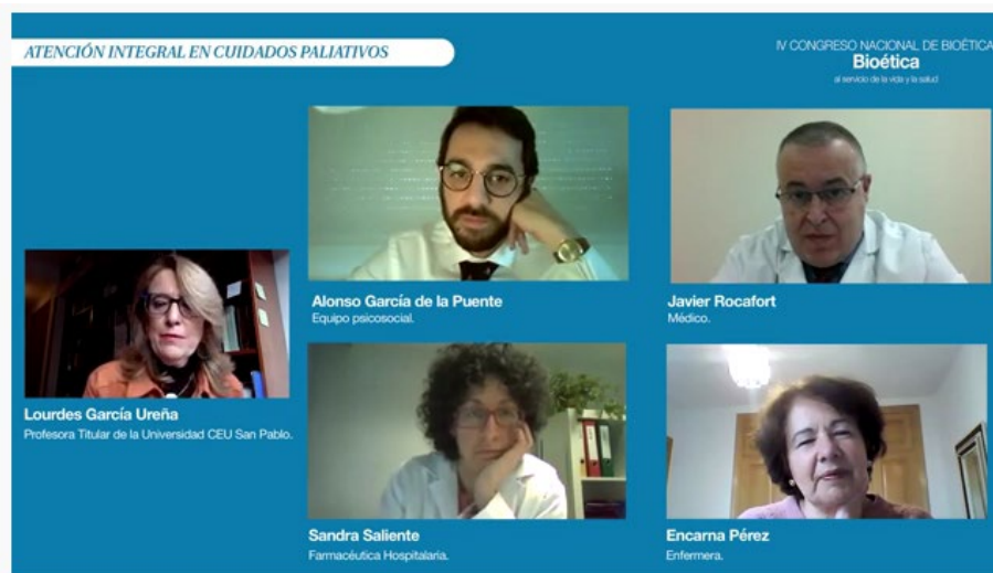
IV Congreso Bioética: 5 - EQUIPO PALIATIVOS Hospital La Laguna.

Presentación semipresencial: Título de Experto de Doctrina Social de la Iglesia